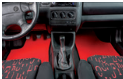
Autoteppiche nach Mass