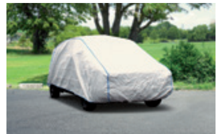
Autohüllen – In-/Outdoor