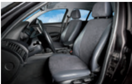
Autositzbezüge nach Mass